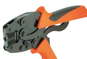
...0200, Modell PZ 3