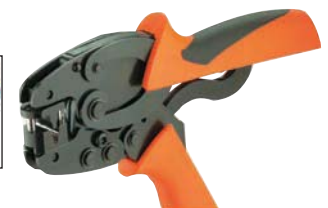
...0300, Modell PZ 6 roto