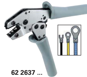
62 2637 ...