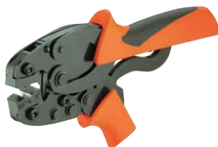
...0100, Modell PZ 4