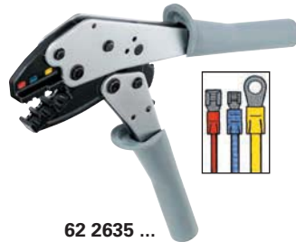
62 2635 ...