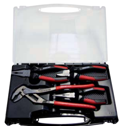
...0400 / 4-teilig