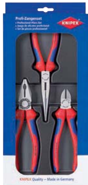
...0200 / 3-teilig