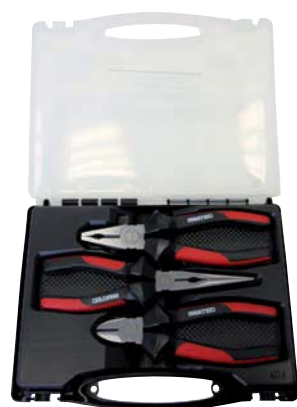
...0200 / 3-teilig