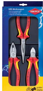
...0300 / 3-teilig