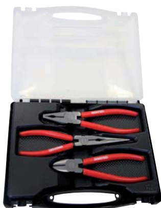
...0100 / 3-teilig