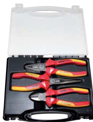
...0300 / 3-teilig