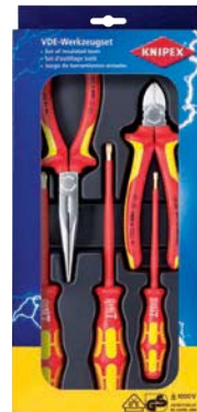
...0400 / 5-teilig