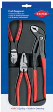
...0100 / 3-teilig