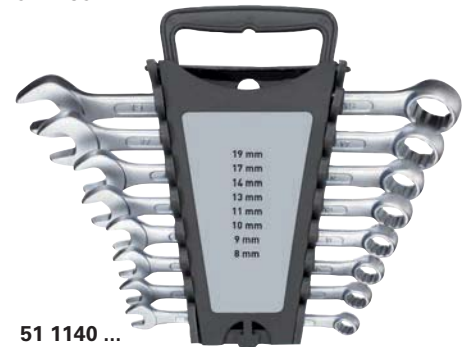
51 1140 ...

51 1140 IMATEC aus Chrom-Vanadium-Stahl, verchromt, im Sichtkarton.