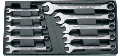
51 1135 ...

Verpackung: 1) Karton mit Klarsichtdeckel 2) Rolltasche mit Klettverschluss 3) Kartonverpackung