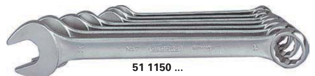
51 1150 ...