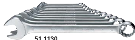
51 1130 ...

51 1135 STAHLWILLE Open Box aus Chrome-Alloy-Steel, verchromt. Das AS-drive Profil ermöglicht hohe Kraftübertragungen auf die Flanken von Schrauben und Muttern, ohne diese zu beschädigen.