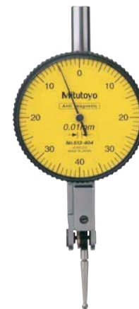
33 1525 ...