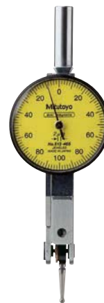
33 1520 ...