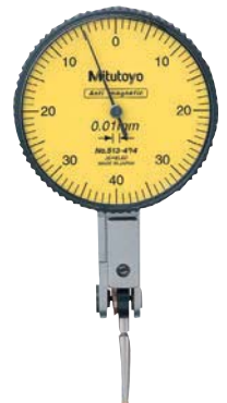
33 1530 ...